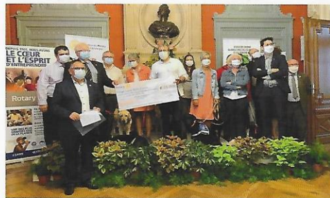
Cérémonie de remise de chèque avec des membres de l'association et du Rotary Club de Roanne

méa le Rotary club de Roanne, et notre équipe de salariés ainsi que les bénévoles, administrateurs, maîtres chiens guides remercient très chaleureusement tous les membres du club de leur engagement fidèle pour notre cause.